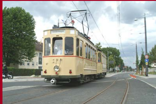
Baureihe ST 3, Baujahr 1925/26 Donnerstag, 25. Mai 2017

Zum Einsatz kommen an folgenden Tagen folgende Fahrzeuge: