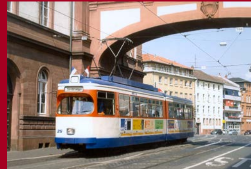
Baureihe ST 7, Baujahr 1961 Samstag, 27. Mai 2017